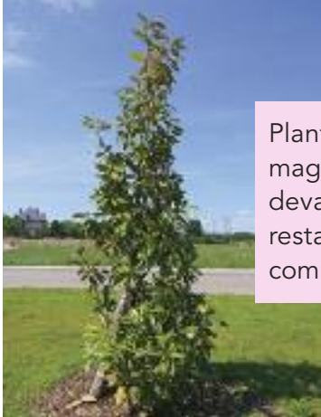
Plantation d'un magnolia grandiflora devant le futur restaurant du centre commercial.

Les plantations d'arbres et végétations diverses se poursuivent aux abords du lac. Au total 39 nouvelles plantations dont 12 nouvelles variétés tels que févier (gléditsia triacanthosinermis), savonnier (koelreuteria), arbres de fer (parrotia persica), cerisier des oiseaux (prunus avium), myrobolan (prunus pissardi), grand chêne (quercus pétraea), chêne du Mexique (quercus rhysohylla), chêne liège (quercus suber), chêne des Pyrénées (quercus toza), sophora japonica, magnolia grandiflora, pin, sophora pleureur (sur l'île).